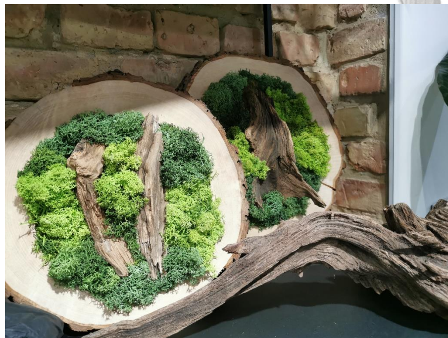
Obrazy na plastrach drewna