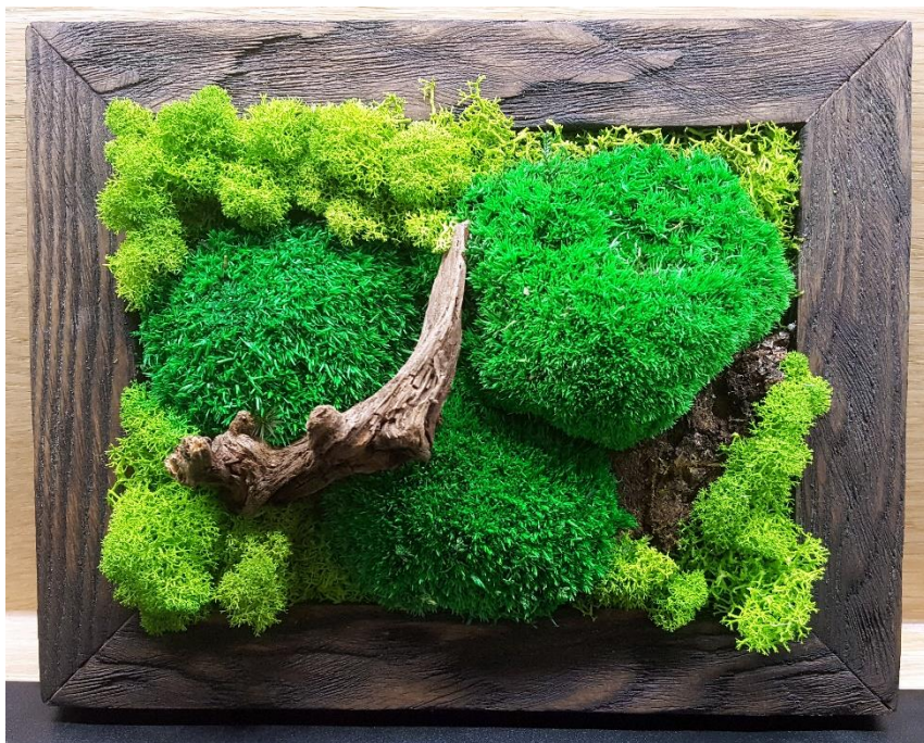
Obraz w ramce z postarzanego drewna

W pracowni wykonujemy szereg obrazów, dekoracji, ozdób z użyciem roślin i mchów stabilizowanych. Możemy również wykonać elementy wg dostarczonego przez Państwa projektu. Ramy do obrazów wykonujemy z drewna, metalu , tworzywa oraz wielu innych materiałów. Kształt, rozmiar czy sposób montażu również jest elementem możliwym do modyfikacji . W celu wyceny prosimy o kontakt bezpośrednio z pracownią. Poniżej przedstawiamy kilka wybranych naszych realizacji.