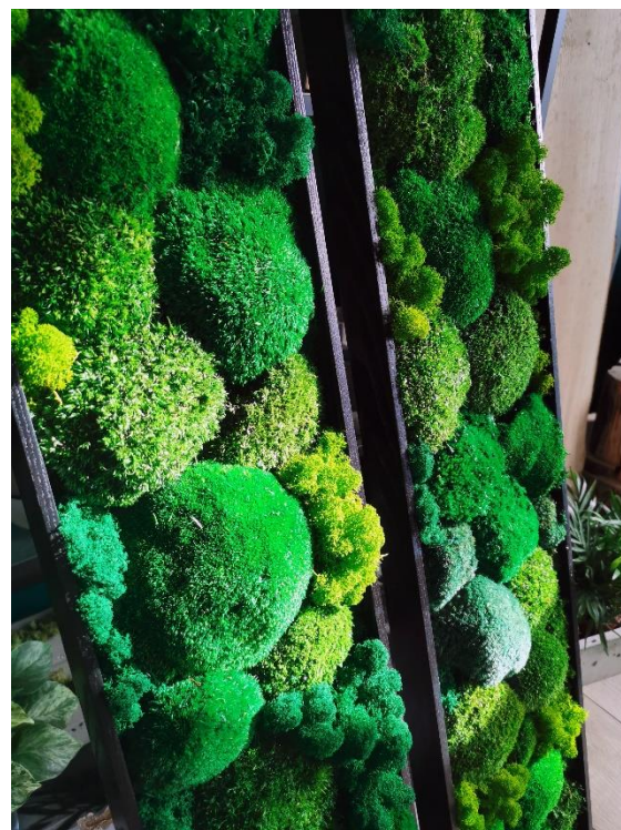
Panele ścienne w drewnianych czarnych ramach.